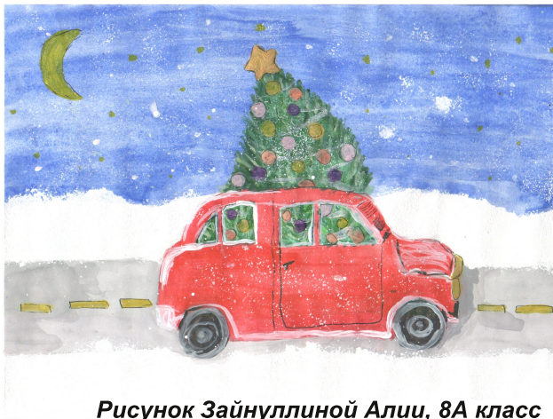
Рисунок Зайнуллиной Алии, 8А класс