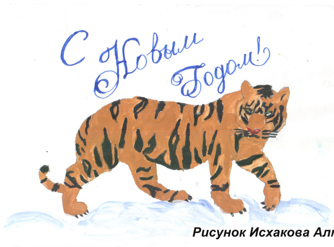
Рисунок Исхакова Алмаза, 6 класс

Постучалась к нам зима, Ворвались в дом холода. Внезапно пушистые ели Белые шубки свои одели.