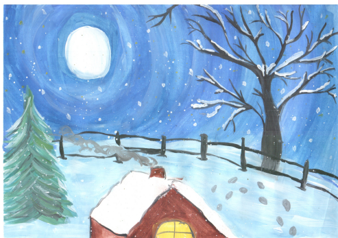
Рисунок Зайнуллиной Алии,